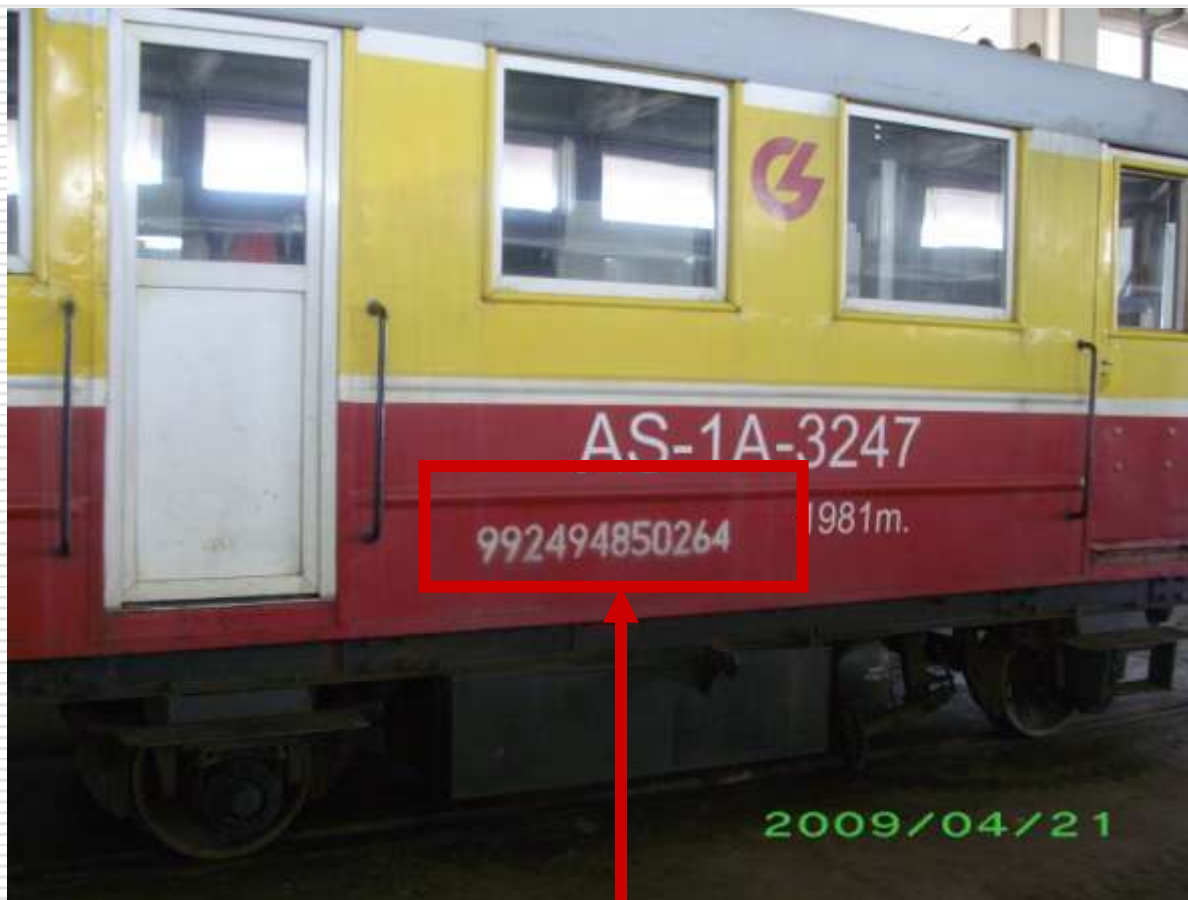
12 ženklų identifikavimo numeris